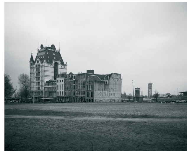
Kim Bouvy, Aus der Fotoserie Phantom City , 2010, Fotografie, s/w, variables Format. Im Besitz der Künstlerin. © Kim Bouvy und Pictoright Amsterdam 2012

und vom Stadtarchiv. Oliver Godow (geb. 1970) verbrachte drei Wochen in Rotterdam, um direkt vor Ort zu recherchieren und dieses Material für seine Installation im Stadtraum Wilhelmshaven (und in der Ausstellung) einzusetzen. Jost Wischnewski (geb. 1962) knüpft mit seinen Fotografien an seine seit 2007 laufende Arbeit und die Vorgängerausstellung Ziel: Wilhelmshaven (2010) an und präsentiert neue Arbeiten. Neben den neuen Fotoarbeiten wird Kim Bouvy auch ihre preisgekrönte Fotoserie Phantom City (2010) zu Rotterdam in der Ausstellung zeigen. Gemeinsam ist allen Fotografen, „Stadt“ als sozial-politisch gewachsenes Gefüge wahrzunehmen und jeweils signifikante Marginalien in deren Geschichte anhand früherer Fotoprojekte in Rotterdam und Berlin (Bouvy), Augsburg und Winterthur (Godow), Düsseldorf, Rom und Wilhelmshaven (Wischnewski) sowie Los Angeles und Palermo (Somers) bereits sichtbar gemacht zu haben.