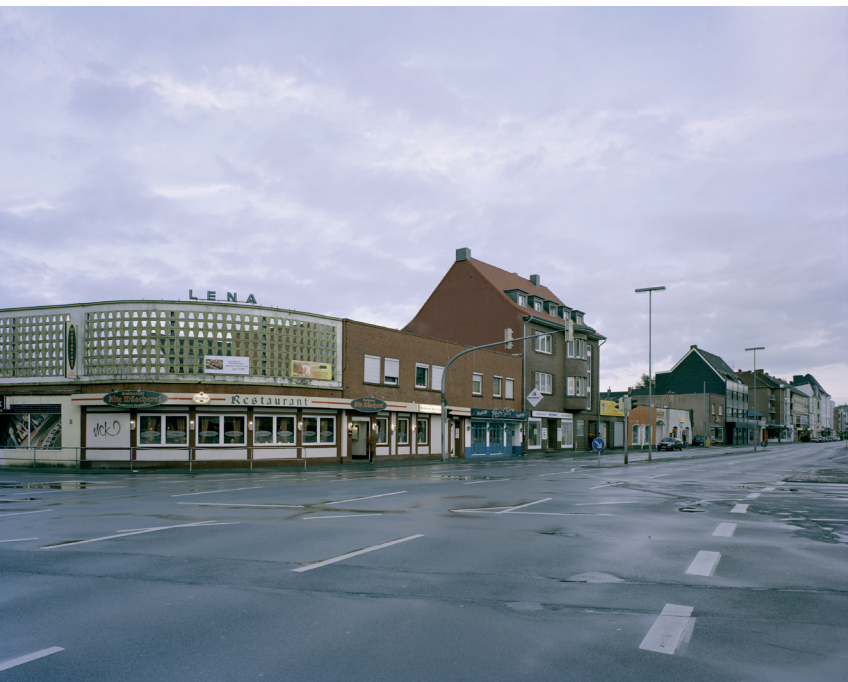
Kim Bouvy, Aus der Fotoserie Ohne Titel (Gökerstraße/Mühlenweg) , Wilhelmshaven 2012, Fotografie, Farbe, variables Format.

Die Stadt Rotterdam gilt wie Wilhelmshaven als „Stadt der Visionen“. Die spannenden Affinitäten zwischen den beiden an der Peripherie Europas gelegenen Hafenstädten stehen im Zentrum dieser Ausstellung. Rotterdam wurde – wie Wilhelmshaven – während des 2. Weltkrieges fast vollständig zerstört und besitzt heute eines der größten Containerschiffterminals der Welt. Einst als architektonisch gesichtsloses Baumonstrum abgetan, entdeckt seit kurzer Zeit eine Reihe von Künstlern ihre in der Wahrnehmung stark gewandelte Nordseestadt wieder. Rotterdam besitzt seit den 1990er Jahren nicht